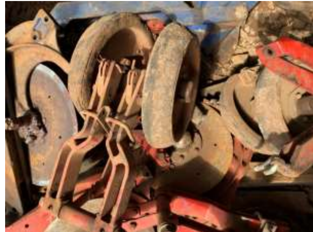
8.8. Foto 8