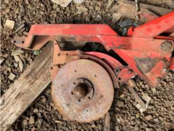
8.16. Foto 16