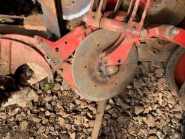
8.10. Foto 10