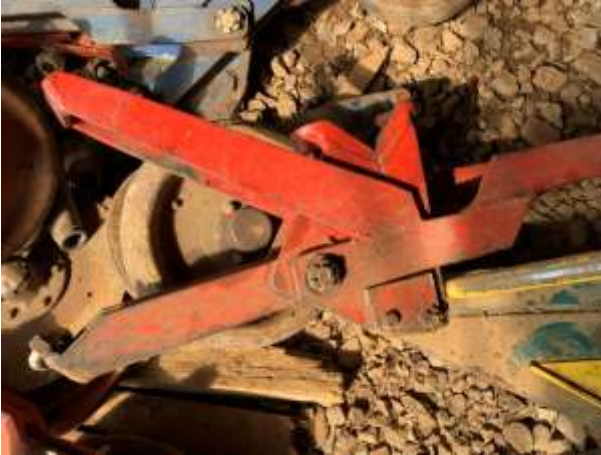
8.7. Foto 7