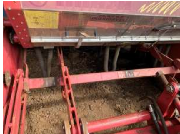
8.5. Foto 5