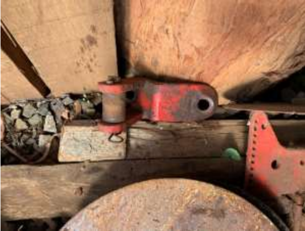
8.13. Foto 13